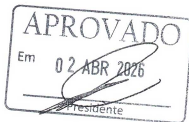
CECÍLIA RIBEIRO CABRAL (CECÍLIA CABRAL) Relatora